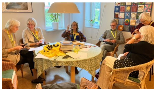
Förmöte inför Open House.