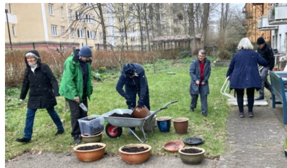
Snö faller under trädgårdsdagen i april. Kronärtskocka i planteringslåda och tillagad (nedan).

Under sommaren vattnades krukor och klipptes gräs enligt schema där alla grannar anmäler sig veckovis.