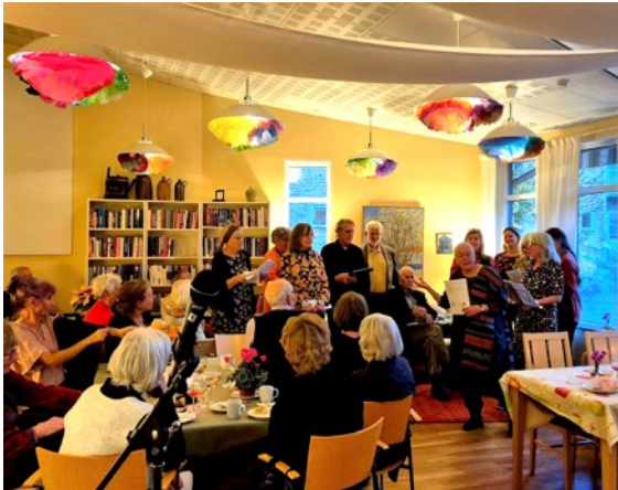
Färdknäppskören sjunger på Stolplyckands 25-årsjubileum.

Efter ett par års uppehåll återstartades kören under 2024. Vi hade vår första repetition den 18/2 och avslutade året med en fest den 8/12. Vi har repeterat söndagar 18.15 – 20.30.