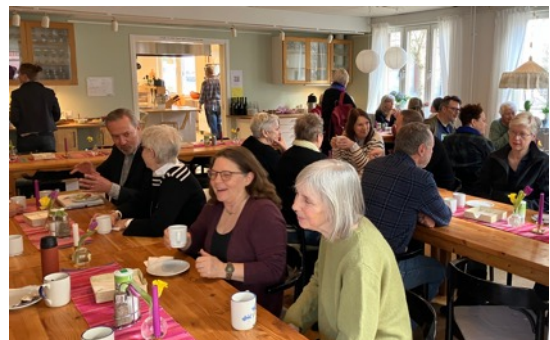
Idébytdag mellan kollektivhusen i Sverige i matsalen.