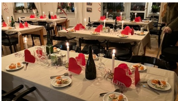
Fredagsmiddag den 8 november med extra allt via trivselpengar