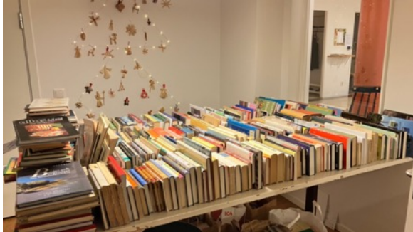
En del av årets stora bokbord i december.