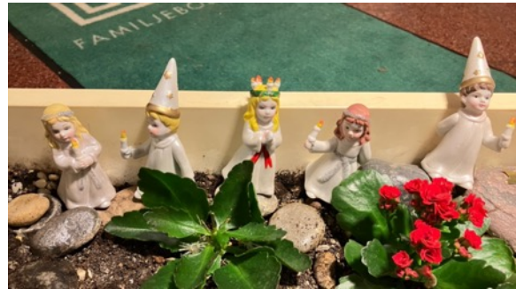
Ett litet luciatåg i planteringslådan i B-entrén. Karin Flöjte sköter om och varierar växter och innehåll i lådan..