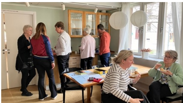
Kursdeltagare från Leyden Academy of Health Care på rundvandring och information om Färdknäppen.