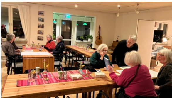
Arbete i smågrupper vid soffan om gemensam värdegrund.

Vi har för närvarande 67 externa medlemmar som bidrar till huset genom att bland annat vara med i matlag. Ett stort tack till alla dessa medlemmar!