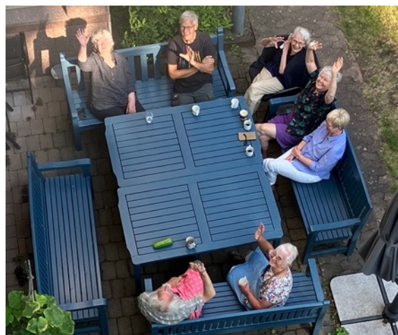
Trekaffe i trädgården