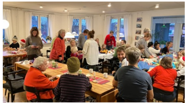
Julpysseldags i Färdknäppens matsal.

Söndagen den 8 december fylldes matsalen av 65 gäster – varav ca 30 var barn, från ganska små till ganska stora – alla glada pysslare. Pysset var att göra julgransgirlinger eller små flätade korgar att hänga i granen, pynta apelsiner med nejlikor, pynta ljus med vax i olika färger och utstansade prydnader. Barnen kunde göra smällkarameller (utan smäll, men med godis i), måla tomtar eller granar i trä samt baka pepparkakor. Det var två intensiva timmar. 1121 kr samlades in till Läkare utan