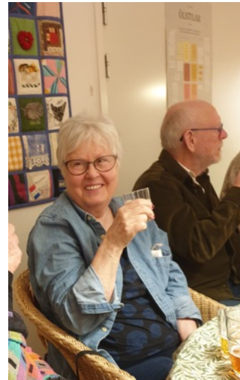
Majsan på ölprovning i allrummet.