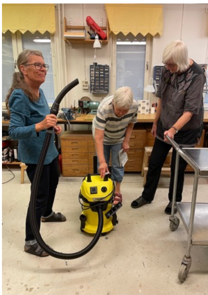
Test av husets nya dammsugare, en Kärcher.