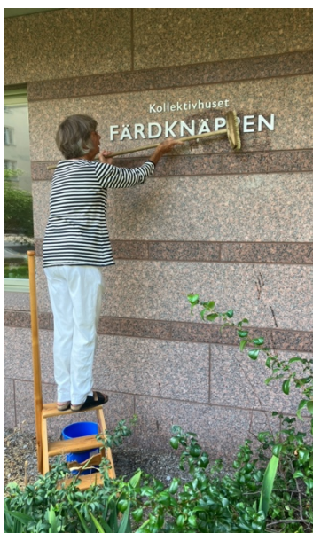
Även kollektivhus skylten behöver rengöras