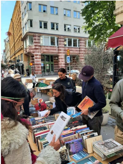
Färdknäppens bokbord på Drottninggatan i augusti.