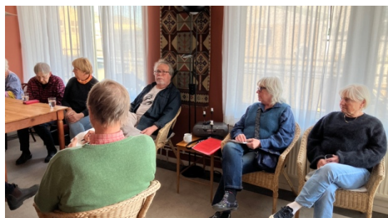
Intressegruppen för Familjebostäders kollektivhus möttes i april i takrummet.

Gruppen med representanter från Familjebostäders kollektivhus har träffats två gånger under året för att diskutera gemensamma frågor. Det första mötet skedde på Färdknäppen. Försäkringar och hur de "nya" el-avtalen slår för oss som kollektivhus diskuterades. På det senare mötet diskuterades el-avtalen vidare samt att