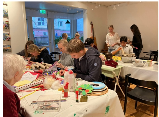
Full aktivitet under pysseldagen med många olika julpyntstationer.