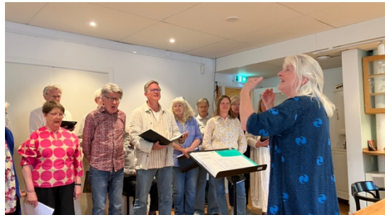
Färdknäppskören bjuder på "smått och gott" i matsalen i juni.