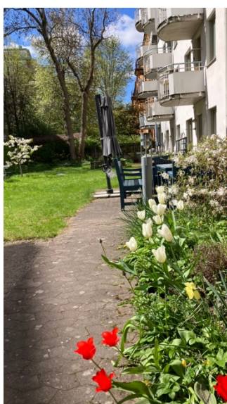
Blommande lökar och magnolia