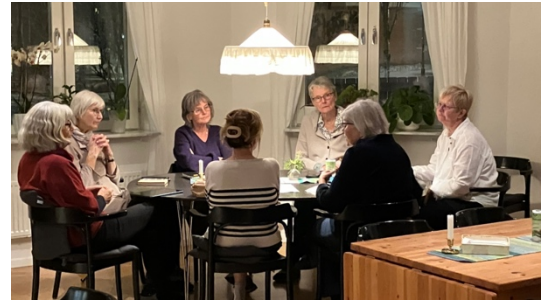
Hushållarnas novembermöte i matsalen.

Kontakterna med Familjebostäder har skett huvudsakligen genom att fel och önskemål tagits upp på de ordinarie kvartalsmötena. Akuta