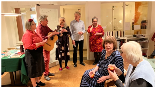
Tapasfest med underhållning av Husbandet och sangria i glaset i november.

Den 29 november ordnade fest- & underhållningsgruppen en spansk tapasfest exklusivt för de boende i Färdknäppen. Det bjöds på tapas, ost & kex, vin & sangria samt tipspromenad, allsång, quiz och "matlagsuppträdande". Festen var gratis för alla boende då den finansierades av våra gemensamma medel samt bidrag från hyresgästföreningen i regionen. Totalt var 34 medlemmar med på festen.