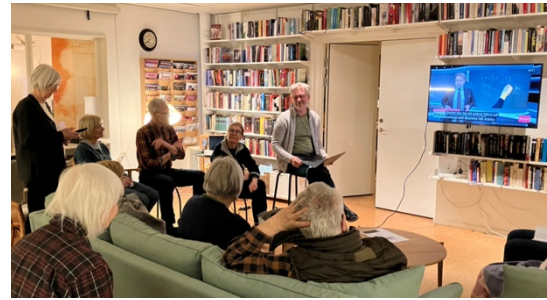
E-gruppen demonstrerar några av husets elektroniska prylar i februari.