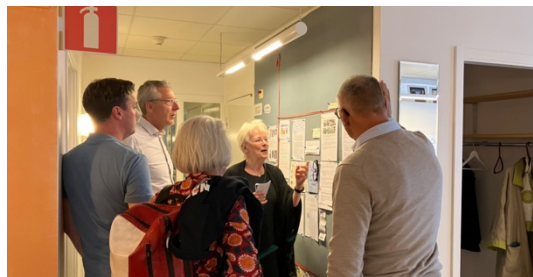
Lotta B guidar några av deltagarna Leyden Academy on Vitality and Ageing Lika nyfikna på allt som deltagarna tidigare är.