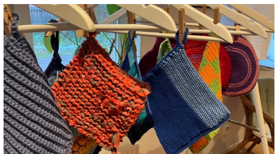
Grytlappstillverkare och grytlappsresultat.