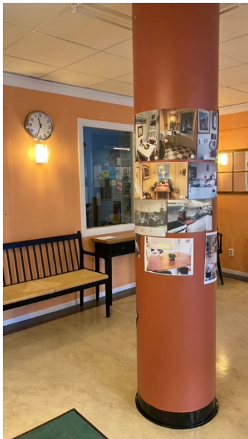
Vems kök – frågetävling i januari på pelaren på torget.

DN 20 oktober "Fler vill flytta in i kollektivboende" bl a om Färdknäppens Öppna hus. Råd & Rön 7:2025 "Bo ihop" om bl a kollektivhuset Sofielund i Malmö och coliving. Kungsbacka-Posten 6 mars "Delat boende – för hållbarhet och mot ensamhet".