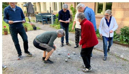
Bouleturning i trädgården - avstånden är avgörande!