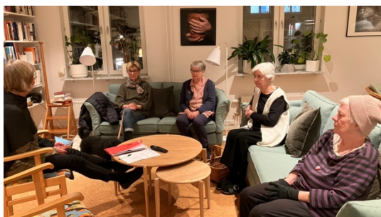
Biblioteksgruppen sammanträder i allrummet.

Gruppen har haft sex protokollförda, utannonserade möten i biblioteket/allrummet (16 januari, 17 mars, 13 maj, 27 augusti, 20 oktober och 1 december).