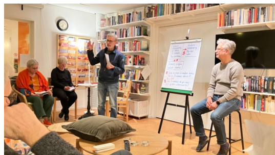
Soffmöte om lägenhetsfördelning och lägenhetsbyten.

Vi har haft en s.k. Soffa under 2025 gällande regler vid lägenhetsfördelning.